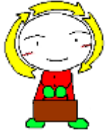
ながのけんりサイクル キャラクター「くるるん」